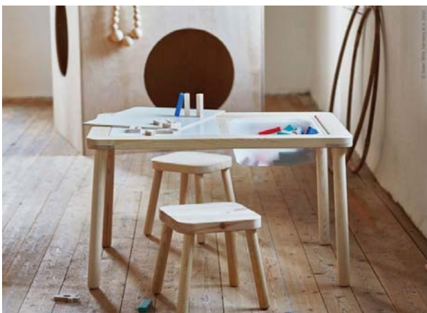
Gyermekbútor óvodáknak, bölcsődéknek

A gondolatot, amelyet saját munkatársai előtt is nehezen védett meg, később igazolta a Harvard Egyetem egy kutatása, melynek eredménye szerint azt a bútort, amit a tulajdonos