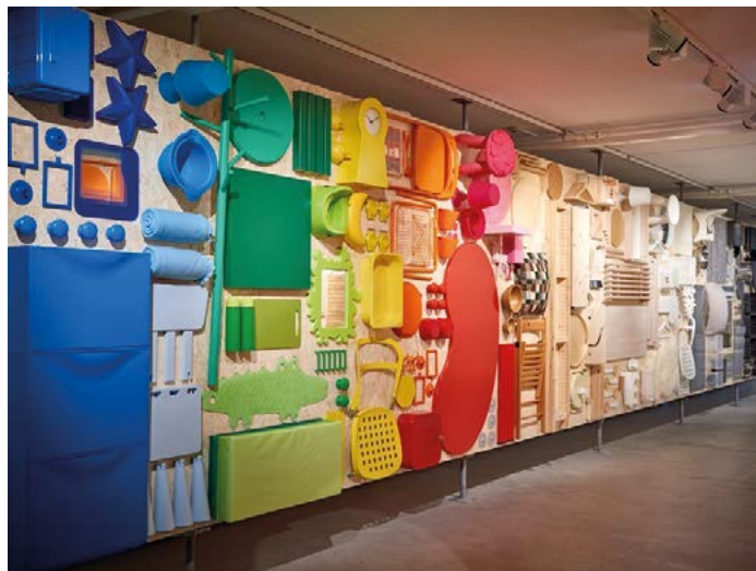
Az IKEA-múzeum egyik bemutatófala

Környezetvédelmi megfontolásokból tervezi a nála vásárolt használt