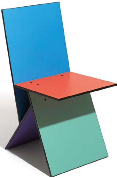
VILBERT szék (1994)

magát. Vallotta: „Senki sem nézheti le a szegényeket!”. S lám, ebbe is bele lehet kötni: „az alacsony ár a túlfogyasztást gerjeszti” – állapította meg tanulmányában vele kapcsolatban egy stockholmi professzornő. Közben az älmhulti áruház az ott szerzett tapasztalatok alapján felismert és bevezetett szükséges változtatások eredményeként alaposan átalakult, és példaadó mintává vált. Az egyik nagy felismerés szerint „aki több időt tölt a boltban, az többet is vásárol”. Ezért az árutéren átvezető utat labirintusszerűre alakították, s hamarosan megnyílt az első áruházi étterem is (1960). Azóta az ott mindig kínált húsgolyók is az áruházlánc egyik jelképévé váltak.