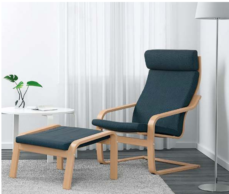
A POÄNG fotel – M. Thonet és A. Aalto nyomában

Figyelemre méltó üzleti érzékre vallott, amikor – szintén még gyermekként – a fővárosból, nagy tételben, olcsón beszerezhető gyufával bővítette készletét – sok kicsi sokra