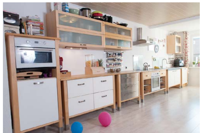
VÁRDE konyha (1999)