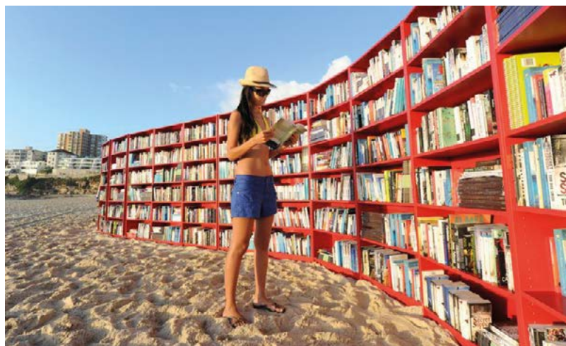
A „hatvanmillió” Billy könyvespolc (1980 k.)

Kampardot az új problémák és a megoldandó feladatok éltették, s szinte szenvedett, ha a cég dolgai rendben folytak. „Soha, senki sem vallott annyiszor kudarcot, mint én.” – mondta pár éve egy interjúban, visszatekintve hosszú, aktív életére. Állítása bizonyára igaz volt, de akkor hozzá kell tenni azt is, hogy a sok kudarcként rázúduló helyzetben rendre megtalálta a kivezető utat úgy, hogy közben cégbirodalma folyton tovább nőtt és erősödött. Mániás spórolásával valószínűleg a világnak kívánt példát mutatni. Több erre utaló gondolatát jegyezték fel. „Nincs szükségünk flancos autókra, hangzatos címekre, státuszszimbólumokra, mert az erőnkre és az akaratunkra támaszkodunk.” Följebb leírt üzleti elveihez egész életében tudatosan ragaszkodva, a szegények megsegítőjének tartotta