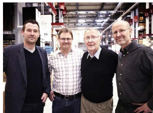
Kampard és fiai

Közben a folyamatosan bővülő, s egyre nagyobb vállalkozás napról napra számtalan megoldandó helyzetet hozott. Munkatársai szerint