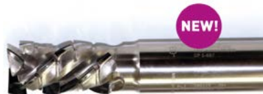
Az új standard gyémántprogram: hosszabb él élettartam, jobb vágási minőség

A LEUCO bemutatja az új standard gyémántprogramját. Minden gyémánt szerszám lapkái jelentősen nagyobb tengelyirányú szöggel készülnek.