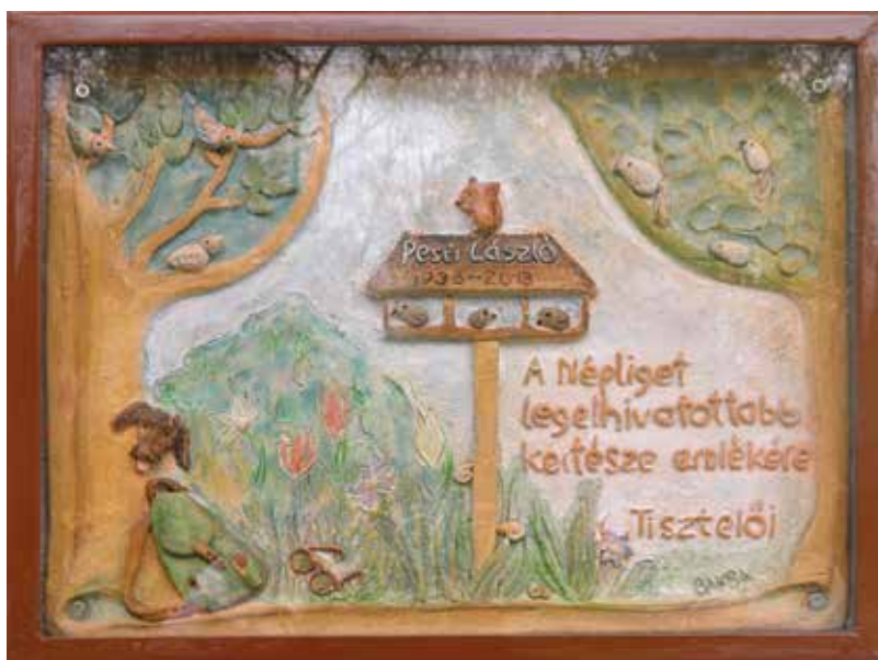
Emléktábla a Népligetben

– Én valószínűleg agglegénynek születtem. Soha nem törekedtem tartós kapcsolatra. Kényelmes ember vagyok – teszi hozzá –, a nyugalom és talán... a megszokás szeretete