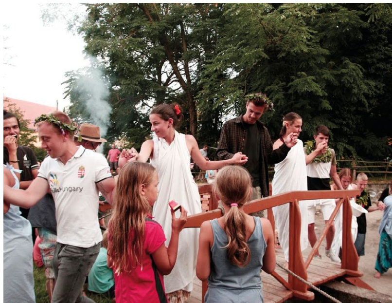
Építkezni lelki szinten is kell