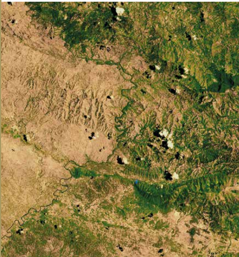
A tudatos környezetvédelem jól látszik Haiti (balra) és a Dominikai Köztársaság határán

Ha nekünk itt, Európában van szükségünk bármilyen célú és felhasználású faanyagra, azt a helyben növő fafajok is messzemenően képesek kielégíteni. Nem kell távoli vidékek faanyagait választanunk, ha időjárásálló és masszív fára, vagy különleges rajzolatú bútoralapanyagra van szükségünk. A régi faiparosok tudástárában rengeteg tapasztalat található az európai kontinentális területeken élő fafajok hasznos és helytálló képességeiről. Ezen kívül ma is vannak olyan kutatások, felismerések, amelyek igyekeznek feltárni a helyi fafajok jól alkalmazható tulajdonságait. Jól ismert módszer a lucfenyő – korábban a vörösfenyő – használata a nyílászárók