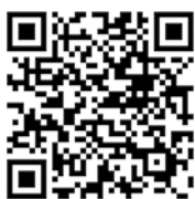
A sötét egzóta faanyagok helyettesítése gőzölt akác faanyaggal

gyártásában. Kültéri faburkolat, faépítmény tekintetében az akác szinte verhetetlen. Évszázados példákat találhatunk szilből, tölgyből készült hatalmas fakapukra és ajtókra; a szép és egyedi bútorok gyártásához pedig a (gőzölt) bükk, a cseresznye és más gyümölcsfák kiválóan helytállnak stb.