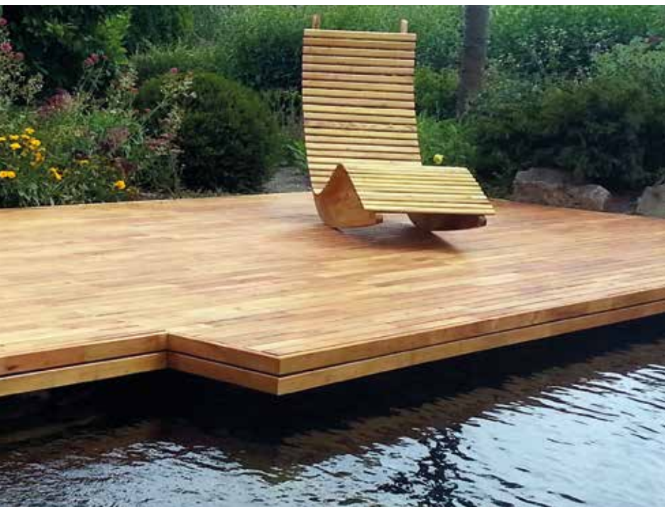
Az akácfa kiválóan állja a kültéri viszontagságokat

gyártásában. Kültéri faburkolat, faépítmény tekintetében az akác szinte verhetetlen. Évszázados példákat találhatunk szilből, tölgyből készült hatalmas fakapukra és ajtókra; a szép és egyedi bútorok gyártásához pedig a (gőzölt) bükk, a cseresznye és más gyümölcsfák kiválóan helytállnak stb.