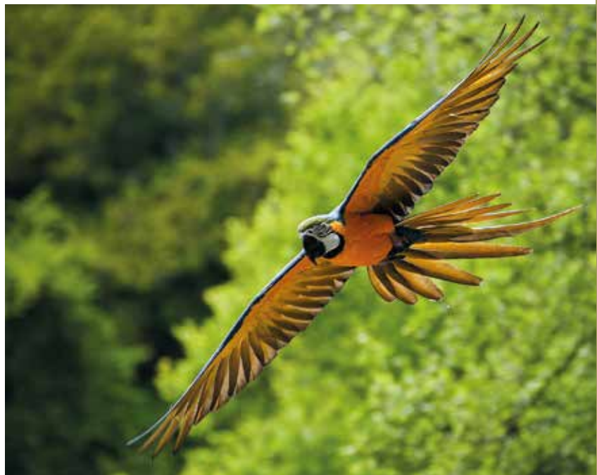
Az amazóniai esőerdőkben él a világ állatfajainak a fele

Vietnam); Közép- és Nyugat-Afrika: Angola, Benin, Guinea, Elefántcsontpart, Gabon, Ghána, Kamerun, Kongó, Libéria); Dél- és Közép-Amerika (Matto Grosso, a leggazdagabb és legnagyobb amerikai trópusi esőerdő, melynek nagyobb része Braziliában található, egyes részei Surinamba, Guyanába, Peruba is átnyúlnak). Az esőerdőkben található fafajok hatalmas sokszínűséget mutatnak: miközben a fás szárú növények fajainak száma jelenleg mintegy 35.000 a világon, csak az egyenlítői esőerdőkben sok-sok ezer faj található, ráadásul ezek nagy részét a kutatók nem is ismerik. A föld tüdejének is tartott Amazonas-medencében lévő esőerdőkben található a világ legnagyobb faji változatossága: becslések szerint km 2 -enként 75.000 különböző faj van itt.