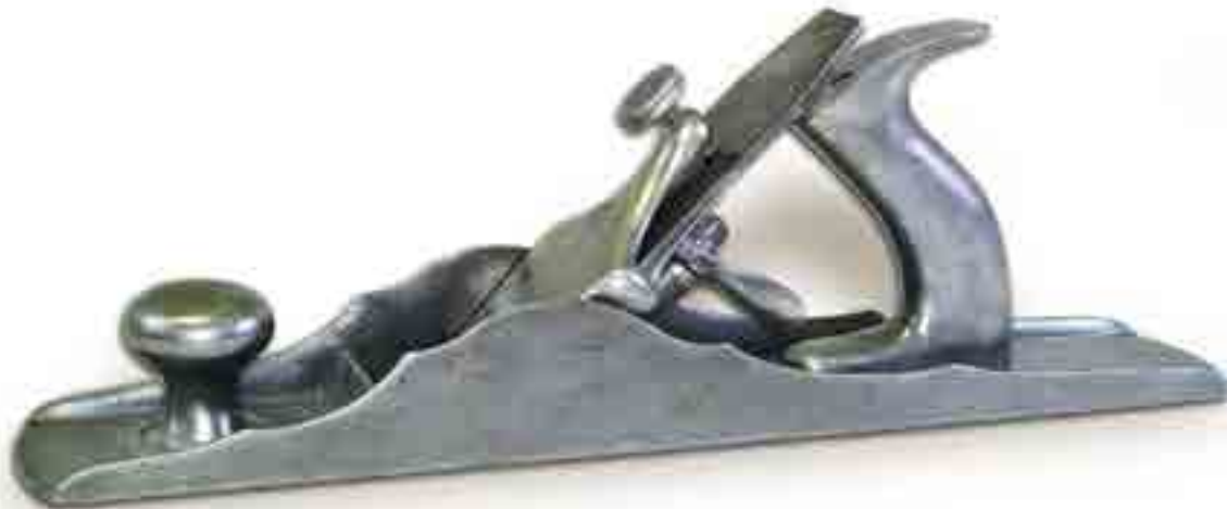
Erőt sugárzó, ugyanakkor elegáns az 1880 körül gyártott Chaplin No. 7