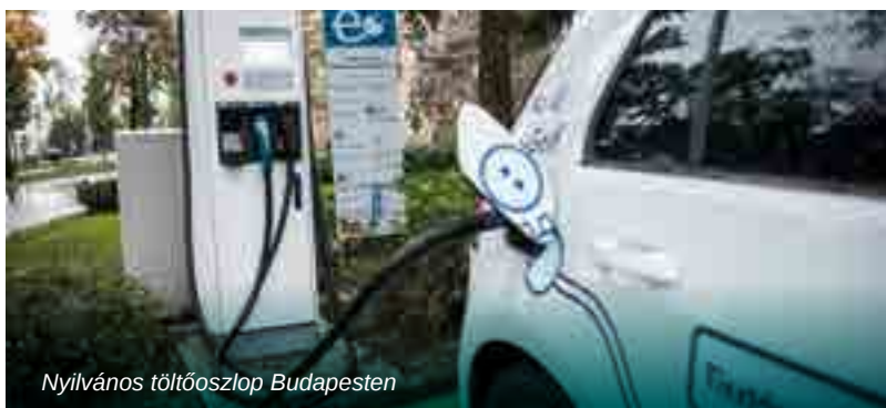
Nyilvános töltőoszlop Budapesten

már 20–30 perc alatt kaphatunk akár 70–80%-nyi töltöttséget is. Mindent egybevetve: új a technológia, s mint minden ilyen, a legtöbb ember idegenkedve fogad. Döntéseinket ilyenkor vélekedéseink, és mások – tudatlanságból vagy rosszindulatból eredő – véleménye is befolyásolja, ám ezek mind csupán feltételezgetések. A stabil tudáshoz a helyes, körültekintő megismerés vezet. Úgyhogy ígérjük: a téma folytatása következik! ■