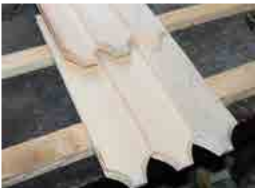
Zsindely rögzítése a tetőléchez

vagy rovarkárosítás. A faszindely hosszú élettartamára van egy egészen természetes magyarázat is, mégpedig az, hogy a fa nagyon könnyen alkalmazkodik a mindenkori klimatikus viszonyokhoz, lett légyen az hasított vagy fűrészelt zsindely. Ennek oka a következő: ha egy hosszú eső után a nedves zsindely száradni kezd, akkor zsugorodásnak indul a hossza mentén azon a felületen, ahol a nap éri. Mivel a zsindely belső felületének nedvességtartalma meghaladja a külső felületét, ezért a fa alakja változik. A belső felületek enyhén felemelkednek, így ki tudnak száradni. Esős idő esetén épp fordított a jelenség, a zsindelyek kitágulnak a felületükön és szilárdan ráfekszenek az alsó rétegre. Abból a célból, hogy ezen ellentétes folyamatok gyakori megismétlődése ne károsítsa a faszindelyt, valamilyeni 60 mm-nél szélesebb zsindelyt két szeggel rögzíteni kell. Azonban itt kell felhívni a figyelmet egy fontos repedésképződési forrásra: a