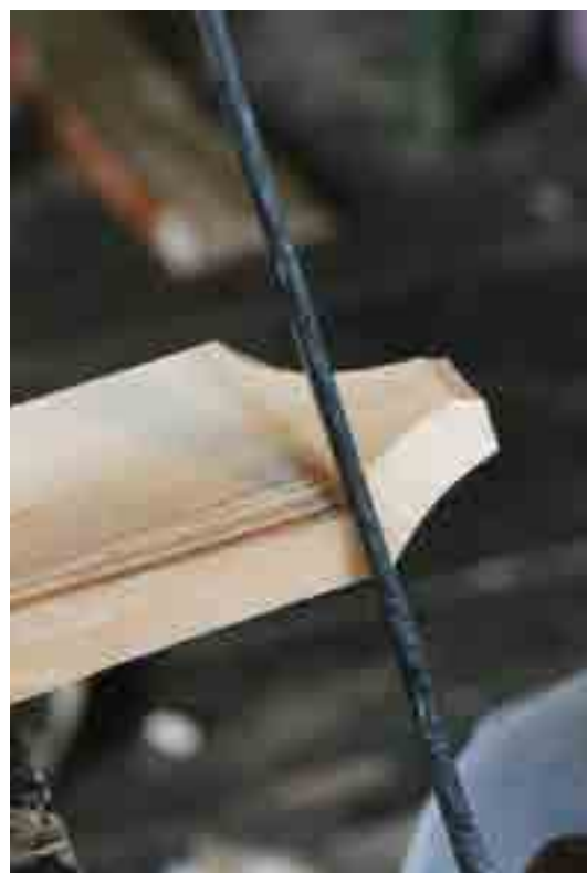
Vonókéssel elkeskenyíti a zsindele végét

pedig 7 db-ot az élével lefelé. Jól be kell ütni a lapokat egymásba, hogy ne tudjanak elmozdulni. A munkát hornyoló késsel kell elvégezni. A kés tartásánál fontos a megfelelő szög beállítása, se nem lejjebb, se nem feljebb nem szabad elmozdítani munka közben. A hornyoló kés jobbos és balos felét váltogatva kell használni. Büszkén meséli, hogy ez a hornyoló kés már több mint 100 éves, még a nagyapáé volt.