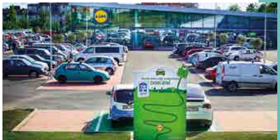
Töltőoszlopok egy bevásárlóközpontnál

a kihelyezett elektromos autó töltőállomások (legyenek azok benzinkúton, bevásárlóközpont, kávézó, útszéli csárda mellett). Ez utóbbiak kiépítése, terjedése rohamléptékben folyik Magyarországon is. Győri lévén megnéztem, hogy 150 km-es körzetben hány töltőpont érhető el (ezt a hatótávot egy kutyaütő akkumulátor is teljesíti). 51-et találtam, ezek közül a legtöbbet hotelek kínálják, de sok van bevásárlóközpont, faluház,