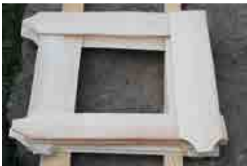
Szárításra négyzetes alakban rakott zsindelyek