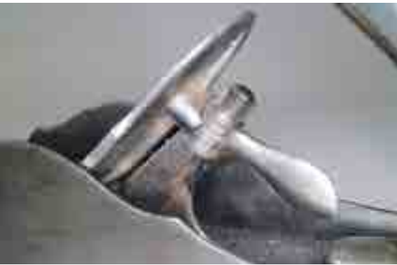
A szabadalom részét képező későnkemelő

alábbi urak és vállalkozások tettek számos erőfeszítést: