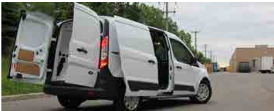
Kis furgon nagy mozgástérrel