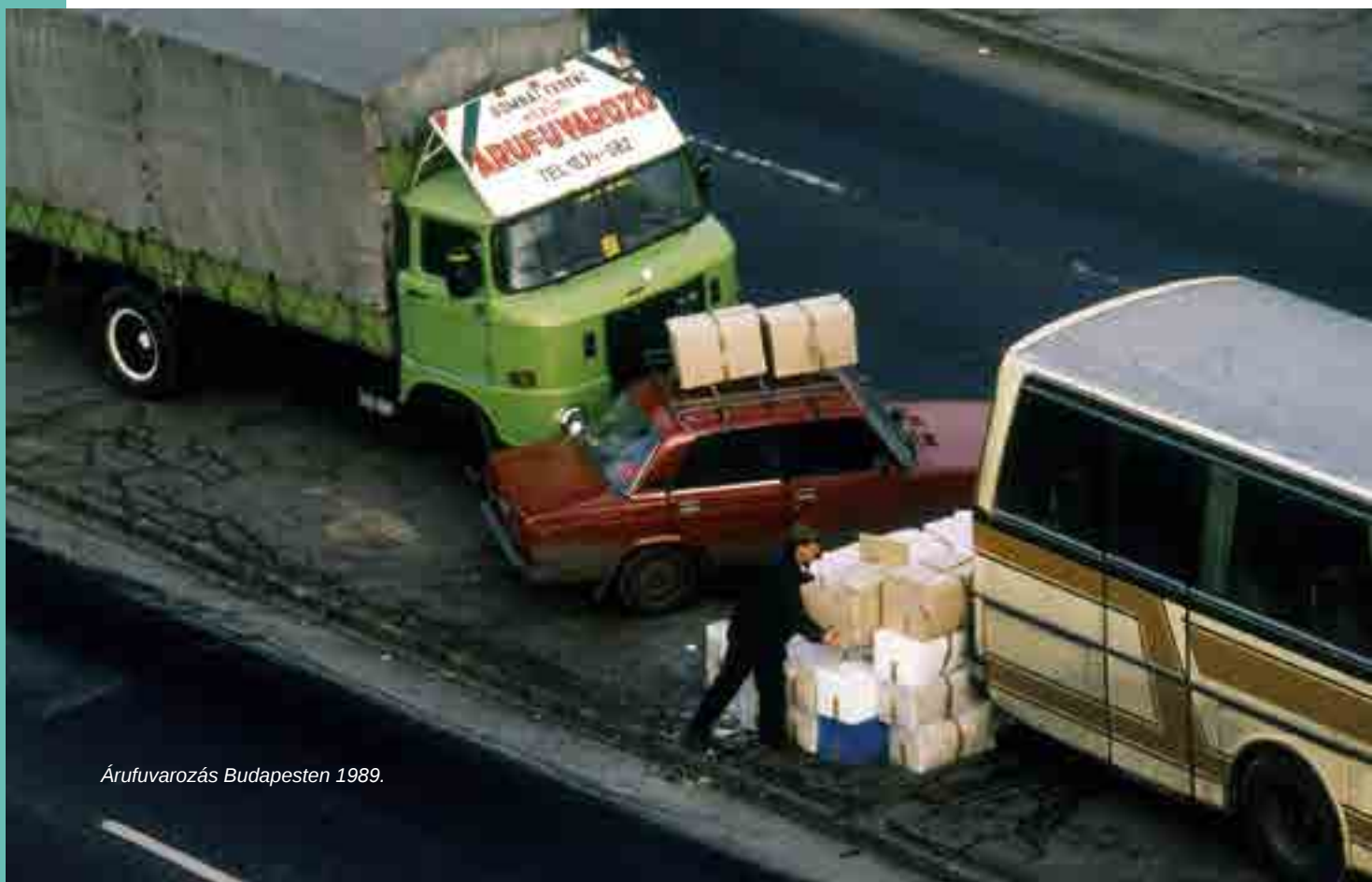
Árufuvarozás Budapesten 1989.