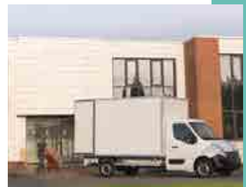
Egyedi felépítményes jármű