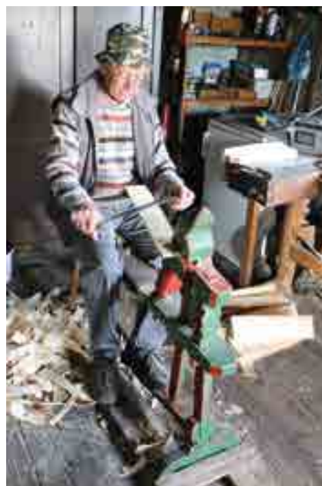
Késelő padon formára faragja

a fa gyorsan ki tudott száradni. Ezzel a természetes védekezéssel érték el azt, hogy a vörösfenyőből, sőt, még a lucfenyőből készült zsindeleket is olyan hosszú ideig fennmaradtak, és nem támadta meg őket gomba-