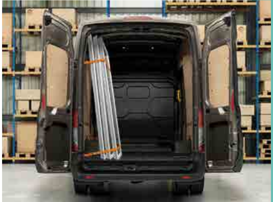
Gondos rakományrögzítés álló helyzetben az oldalfalhoz.

a B kategóriával vezethető furgonok és kisteherautók is a személyautókkal azonos korlátozások szerinti sebességgel közlekedhetnek. De mi a helyzet a járműszerelvényekkel? Például az utánfutót