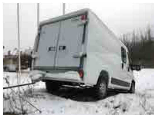
Dupla kabinos alváz külön felépítménnyel

A másik megoldás lehet a dupla kabinos alváz jármű, amire utólag egy hátsó és oldalsó ajtókkal ellátott zárt felépítményt helyeznek. A karosszéria színével megegyező festéssel ez a felépítmény megszólalásig hasonlít egy dupla ülésos kombi furgonra, de mint tudjuk, nem az!