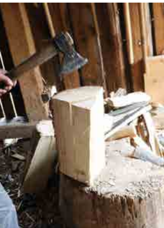
Juvenilis fa eltávolítása