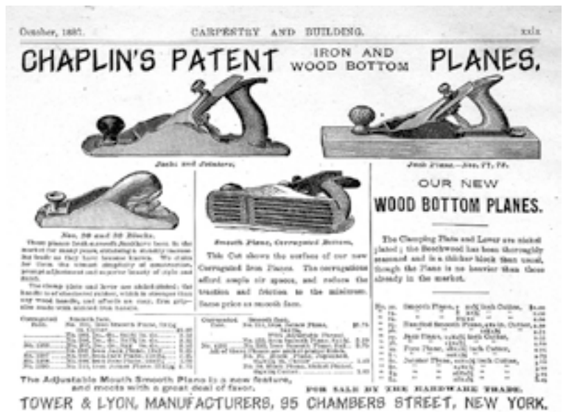
Az 1887-es Tower and Lyon hirdetésben a gyalu már keménygumi markolatot kapott (balra fent)

tudtak fennmaradni. A kisebbek a csökkenő eladások miatt kevesebbet tudtak fejlesztésre fordítani és nem is nagyon volt hova fejleszteni, hiszen lassan megjelentek az első kézigépek. Munkájukat nehezítették az amerikai piac időnkénti pénzügyi hullámvölgyei is, melyekben esetenként cégek százai dőltek be. Sajnos a sok negatív hatást az egyébként nagyon rugalmasan működő Chaplin gyalukat gyártó és forgalmazó cégek sem tudták kivédeni, így 1914-ben befejeződött a Chaplin gyalu több mint 40 éves története. A Chaplin gyalukból mára nagyon kevés maradt meg. Az aukciós fórumokon a gyűjtők hatalmas összegeket fizetnek egy-