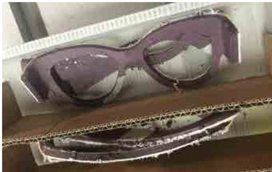
Keretek a munkafolyamat közben

– Kezdetben az interneten keresgettem, és a számomra izgalmasnak