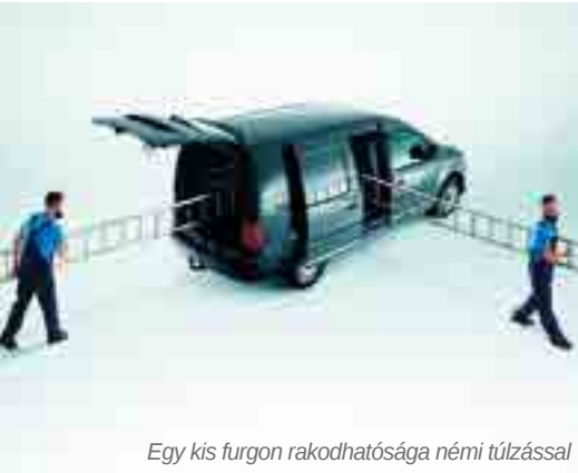
Egy kis furgon rakodhatósága némi túlzással

Ez a típus kis méretű alapanyagok beszerzéséhez, ügyintézéshez, szerelésekhez helyszíni kiszállásra, kisebb bútorok, bútorkiegészítők kiszállítására alkalmas leginkább. A különböző típusok részletes összehasonlítását az I. táblázat mutatja.