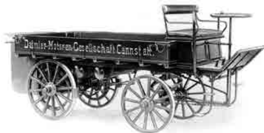
1896 – a világ első teherautója.

Fontos kérdéseket vet fel a közúti teherszállítás szabályozása is. Főleg egy olyan szakmában, mint a faipar: alapanyag tekintetében 6 méteres ablakfrízek, nagy tömegű forgácslap táblák jelentik a kihívást, de a kész bútorok és nyílászárók kiszállítása sem egyszerű, a szükséges létrák, állványok és