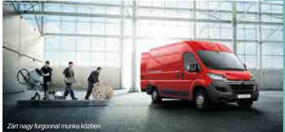
Zárt nagy furgonnal munka közben

A legnagyobb, zárt dobozos kivitelű járművek a 3,5 tonna össztömegű, még „B” kat. jogosítvánnyal vezethető besorolásban. Egyes