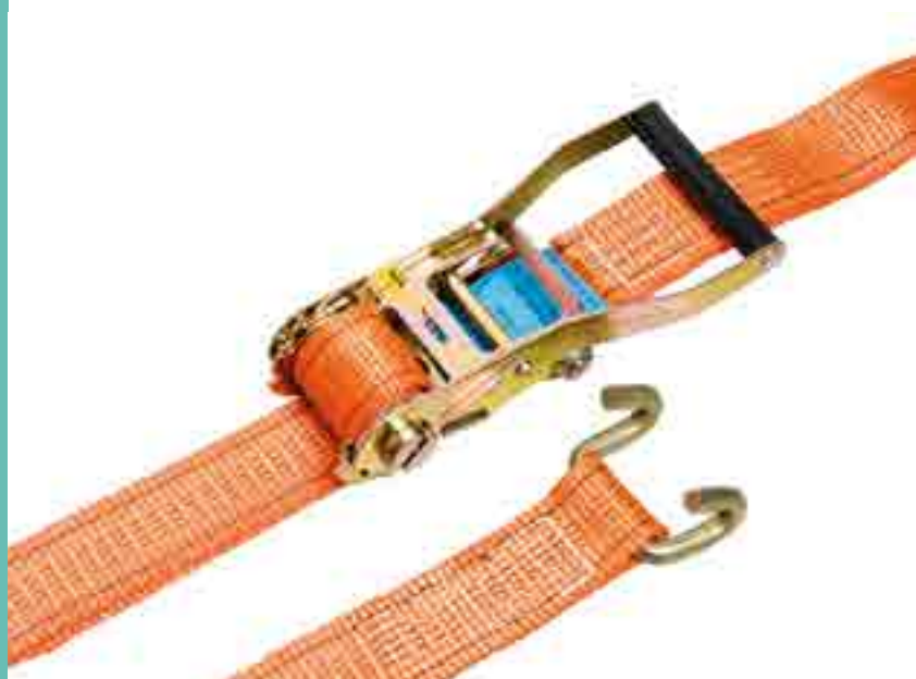
Racsnis rögzítő heveder.

szerszámok szállításáról nem is beszélve!