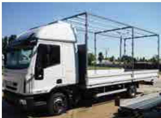
Legyen arányban a teherbírás és a vázszerkezet

műveket alapesetben csak „C” kategóriás jogosítvánnyal lehet vezetni. A nem alapeset az, ha egy ilyen járművet visszaminősítenek 3,5 tonna össztömegű járművé. Erre van lehetőség, és úrvezetőként hivatalosan is vezethetjük. Viszont azzal számoljunk itt is, hogy a jármű