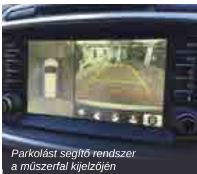
Parkolást segítő rendszer a műszerfal kijelzőjén

állapotban kipörög a kerék, elindulni sem nagyon tudnak. A kipörgésgátlóval (ASR) már korábban is találkozhattunk: ez a hajtott kerekek kipörgését figyeli, és ilyen esetekben a motor fordulatszámát, valamint a fék működését szabályozva állítja vissza a tapadást. Az intelligens menetstabilizáló rendszer ennek egy továbbfejlesztett változata. A tapadás szempontjából nehéz terepen (földes-sáros úton, homokos talajon, hóban), vagy csúszós úton a rendszer a kipörgésgátlótól átveszi a szerepet és a jobban tapadó kerékhez továbbítja a hajtást. A menetstabilizálót az adott útvízszyhoz a műszerfalon elhelyezett gombokat használva lehet aktiválni. A rendszer további előnyei az emelkedőn és a lejtőn való közlekedés segítése (30 km/h sebességig). Emelkedőn elindulva megakadályozza a jármű visszagurulását – egy, a terhelést (sőt, annak eloszlását) is figyelembe vevő fékerőszabályozásnak köszönhetően. Lejtmenetben pedig, különösen laza talajon segíti az egyenes sebesség megtartását – anélkül, hogy a gáz- vagy a fékpedált használni kellene.