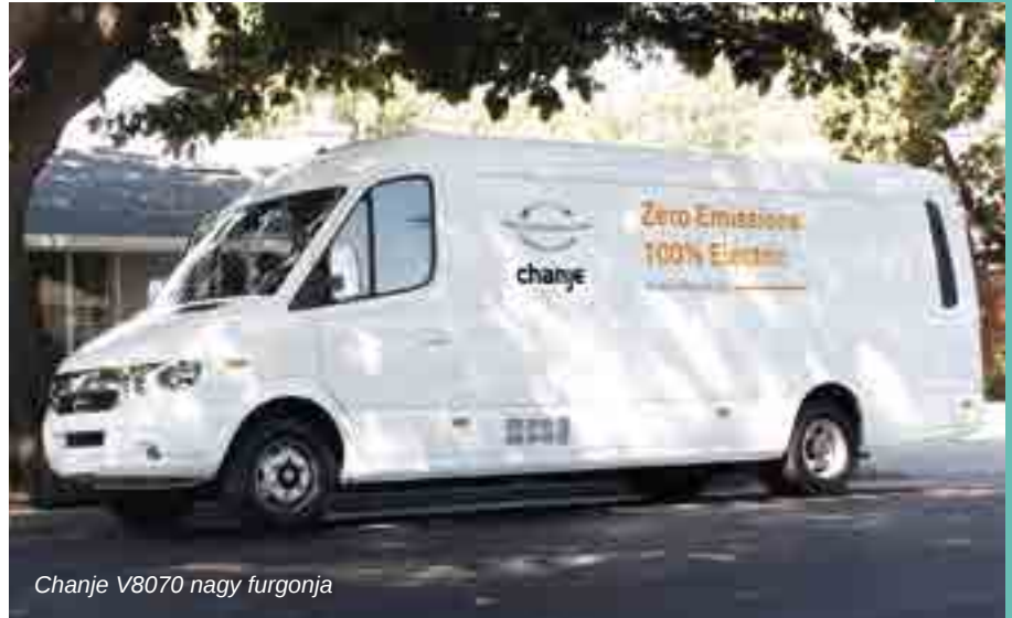
Chanje V8070 nagy furgonja

▼ 15–20 éve még szinte elképzelhetetlen volt, mára már nyilvánvaló: az elektromos járművek és az elektromos autózás valódi alternatívát kínál a belső égésű motorok, autók világában. A kérdés már csak az: mikor fog beelőzni?