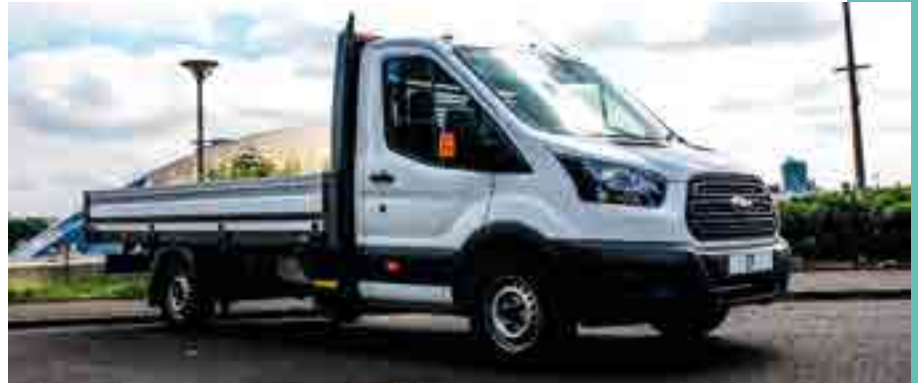
Platós felépítmény alumíniumoldalakkal

nökiroda Kft. tulajdonosa szerint bár óriási felépítmény-méretválaszték áll rendelkezésre a megfelelő alváz esetén, a 3,5 tonnás kategóriában 4500–5000 mm-esnél nagyobbat nem érdemes készíttetni.