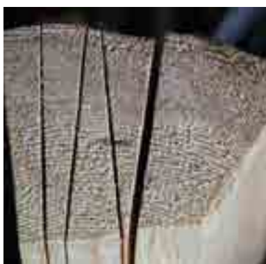
Egy cikkelyből 10–12 db zsindele hasítható