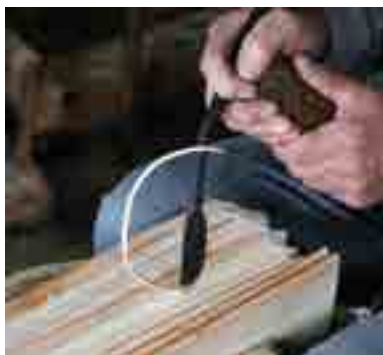
Hornyoló késsel végzi a hornyolást