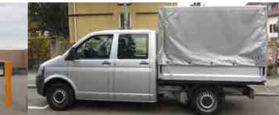
Mindenből egy kicsit: közepes furgon dupla kabinnal, ponyvás platóval

Ez a típus nyújthatja a legnagyobb szabadságot, ha méretes raktérre