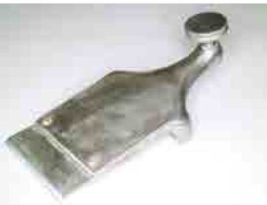
A klipszre szegecselt acéllemez forgácstörő

A felsorolt újítások mind a gyors és pontos állíthatóságot, a könnyű munkavégzést és a hosszú élettartamot biztosítják. A szép formájúra kialakított oldallemezek, melyek az élük felé egészen elvékonyodtak, sokkal elegánsabb, kecsesebb összehatást eredményeztek, mint a konkurens STANLEY gyaluk. Természetesen a legjobb termék is csak megfelelően előkészített és kellően megdolgozott piacon adható el, gazdaságos gyártói háttér meglétével. A Chaplin gyaluk gyártásában sokak mellett az